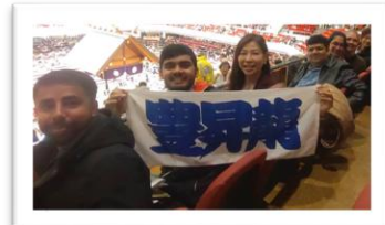
写真左上:満員御礼！ 写真左下:東京スカイツリーをバックに日本をイメージした思い思いのポーズング 写真中央:高安関のタオルと一緒に 写真右:こちらは横綱豊昇龍関のタオルとともに記念撮影