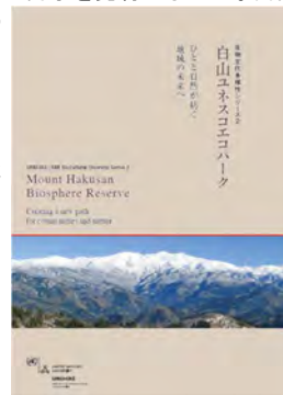
—学びの冊子— 白山ユネスコエコパーク—人と自然が紡ぐ地域の未来—

地域との協働の一例をご紹介します。石川県南部に広がる白山ユネスコエコパークは、2016 年 3 月に開催されたユネスコエコパーク世界大会に於いて、地域が持続可能な生業を営む「移行地域」を新たに含めた拡張登録申請が承認されました。この拡張登録承認を記念して、OUIK では白山エコパークの生物文化多様性とその意義をまとめた冊子を発行しました。白山エコパークに関わる自治体、保全活動を行う地域団体、教育関係者、研究者らに加え、ユネスコ本部よりエコパークネットワークセッションチーフも寄稿し、それぞれの立場からユネスコエコパークをフレームワークとする持続可能な