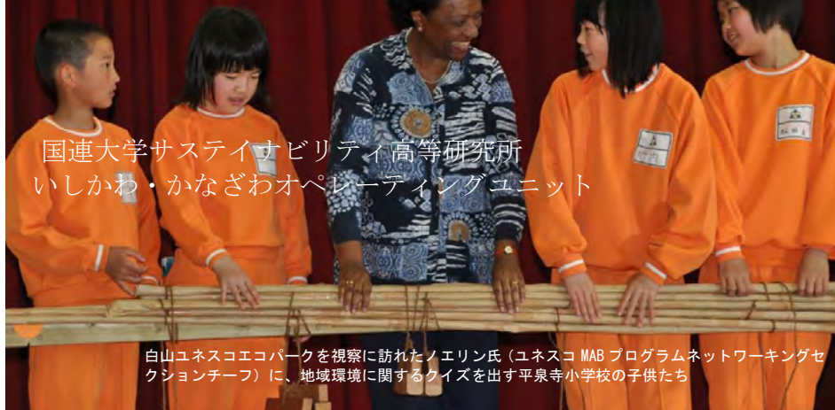
国連大学サステイナビリティ高等研究所 いしかわ・かなざわオペレーティングユニット

白山ユネスコエコパークを視察に訪れたノエリン氏（ユネスコ MAB プログラムネットワークセッションチーフ）に、地域環境に関するクイズを出す平泉寺小学校の子供たち