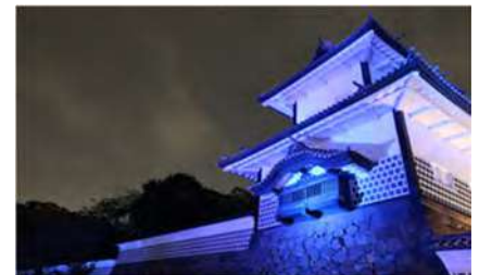
2015 年 10 月に UN70 周年キャンペーンに参加し UN カラーにライトアップされた金沢城

地域づくりを論じています。この冊子のとりまとめや原稿執筆が当事者達の学びであり、発行された冊子はエコパーク対象地域の学校、図書館に配布され地域の環境教育活動に利用されています。また、日英で発行されたこの冊子は、アジア地域のユネスコエコパーク実務者とのワークショップにも研修教材として活用されます。このように学びのツールから様々な活動が生まれています。OUIK は地域と世界を結びながら、学びあいのプラットフォームを推進していく上で、さらに多様な関係者に参画していただきたいと考えています。